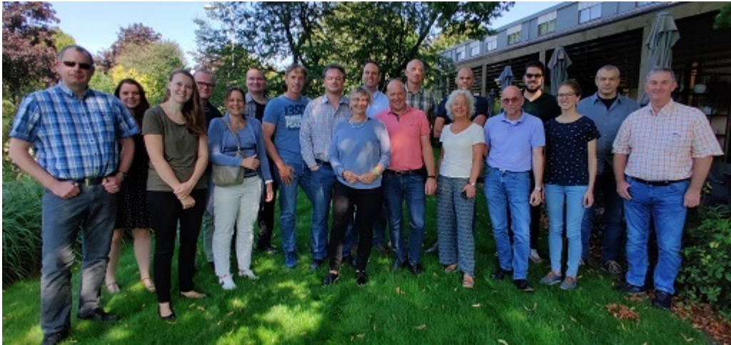
Deelnemers eerste Summer school Arbeid en Gezondheid 2019

heb je je vakkennis en vaardigheden bijgespijkerd.